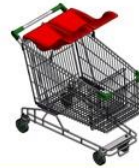
عربة تسوق بمقعد مزدوج للأطفال