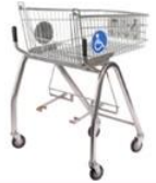
عربة تسوق بكرسي متحرك