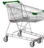
عربة تسوق صغيرة