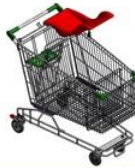
عربة تسوق بمقعد فردي للأطفال