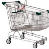
عربة تسوق كبيرة