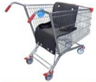
عربات التسوق الخاصة بنوي الاحتياجات الخاصة