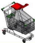
单人婴儿提篮手推车