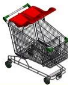
双人婴儿提篮手推车