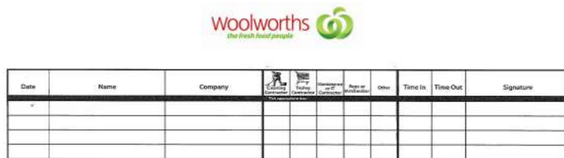
超市“游客贴纸”的示例