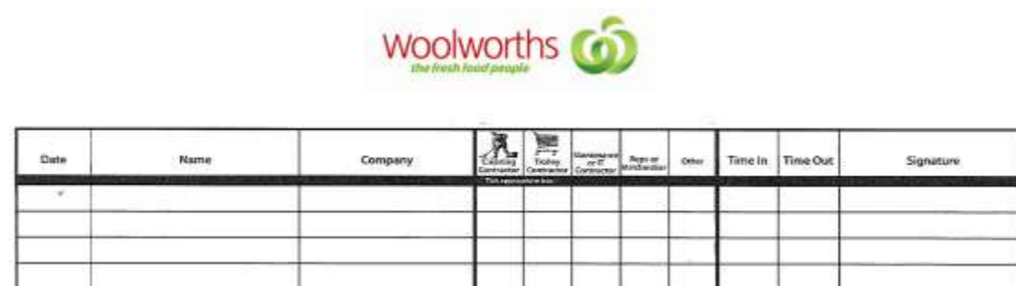
超市“游客贴纸”的示例